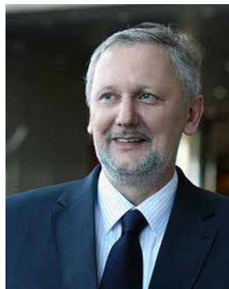
Dr. sc. Davor Božinović, Predsjednik odbora za Međunarodnu saradnju i član Odbora za odbranu i član izaslanstva Hrvatskog Sabora pri Parlamentarnoj Skupštini NATOa

N ATO Youth Model Summit predstavlja simulaciju univerzalnog karaktera, koja se od 2012. god. održava u Briselu sa ciljem bolje informisanosti mladih o NATO-u kao i razvijanja vještina diplomatskog pregovaranja.